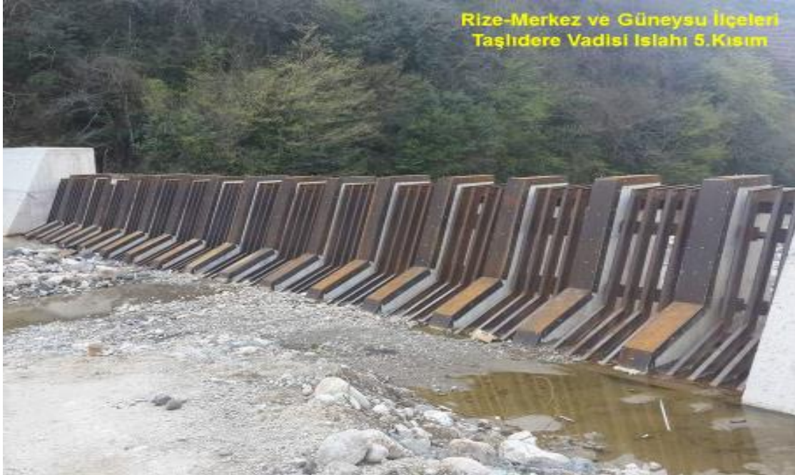
Rize-Merkez ve Güneysu İlçeleri Taşlıdere Vadisi Islahı 5. Kısım